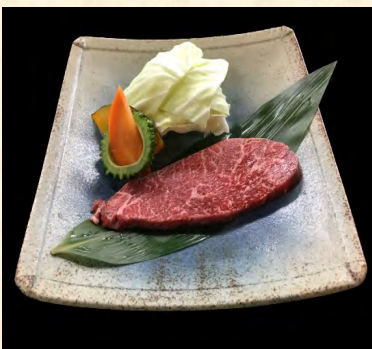
赤身ステーキ定食