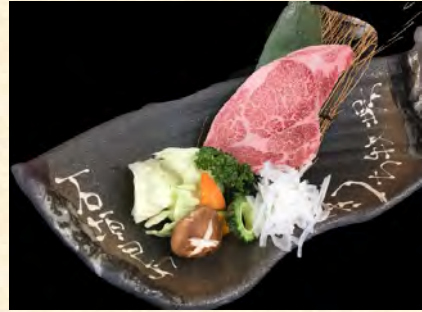
特上ステーキ180g定食