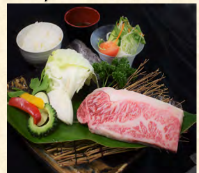
サーロインステーキ