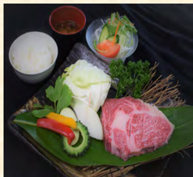
リブローズステーキ